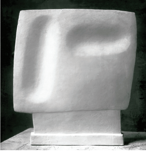
अल्बर्टो जाकोमेट्टी, गोजिड हेड, इ. सं. १९२८, प्लास्टर, जुरिख

दमित इच्छा परिपूर्तिका लागि कसरी अभिव्यक्त गरिन्छ भन्ने सन्दर्भमा लियोनार्दो दा भिन्चीका चित्रलाई विश्लेषण गर्दै यस सिद्धान्तलाई उपयोग गरेका थिए ।