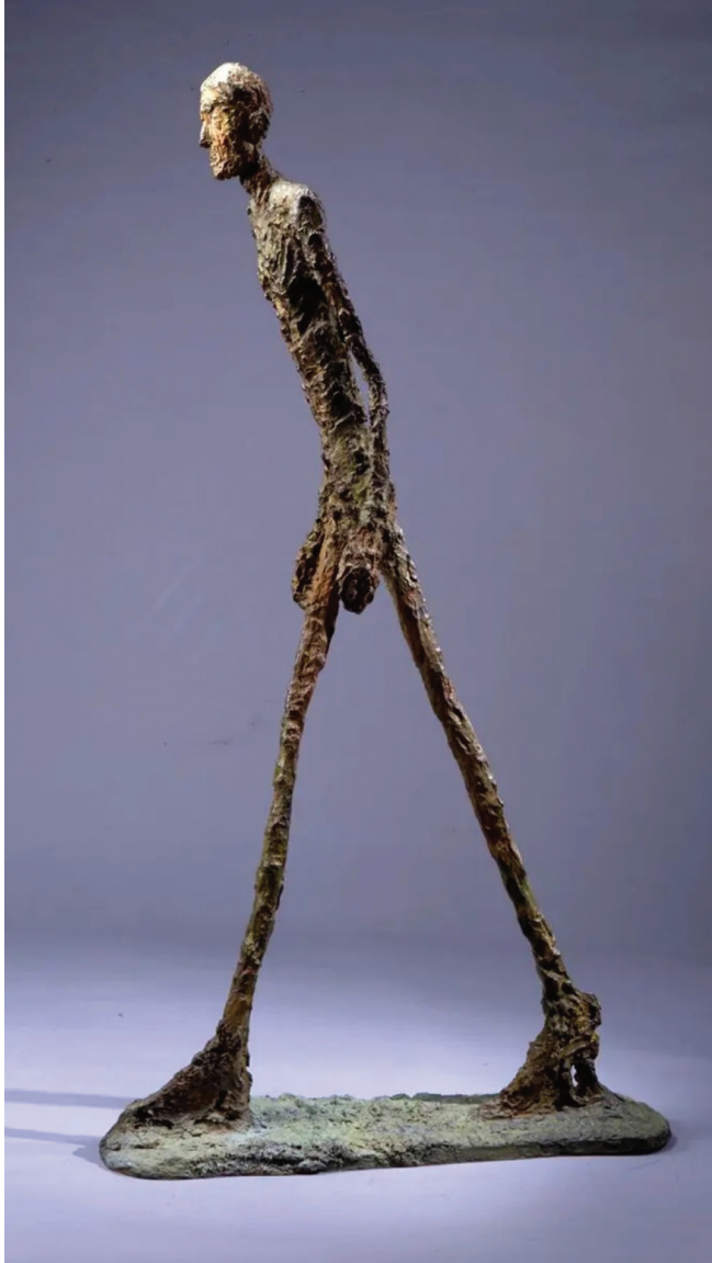
अल्बर्टो जाकोमेट्टी, वाकिङ म्यान-२, इ. सं. १९६०, धातु, २८ से. मि. x १८८ x ११२ से. मि.