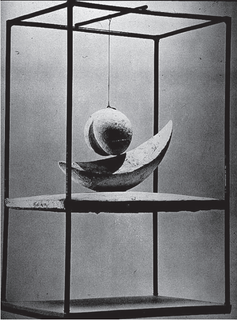
अल्बर्टो जाकोमेटी, सस्पेन्डेड बल, इ. सं. १९३०-३१, धातु, तार, प्लास्टर, टेट ग्यालरी, लन्डन

प्रभुत्व तथा धातु, डोरी, प्लास्टर जस्ता अपार म्यारिक वस्तुहरूको उपयोग गरिएका छन् । स्पेसमा नै क्रियाकलाप हुने गरी मूर्तिको संयोजन गरिएको छ । भइड स्पेसको तुलनामा स्थूल वस्तुलाई सङ्कुचन गरिनाले बहसको विषय बनेको छ । हाल यो मूर्ति लन्डनस्थित टेट सङ्ग्रहालयको सङ्कलनमा रहेको छ ।