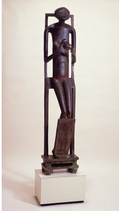
अल्बर्टो जाकोमेटी, ह्यान्ड्स होल्डिङ दि भइड, इ. सं. १९३४

सन् १९३४ मा रचित 'ह्यान्ड्स होल्डिङ दि भइड (इनभिजिबल अब्जेक्ट्स)' जाकोमेटीको महत्वपूर्ण महिला आकृतिको मूर्ति रचना हो । उनको यो मूर्ति अतियथार्थवादी समूहमा आबद्ध समयमा रचित रचनामध्ये पर्छ । यसमा समसामयिक विषय र अमूर्त तत्वको अभिव्यक्ति पाउन सकिन्छ । आफ्ना दिवङ्गत पिताको आत्मालाई दुई हातले