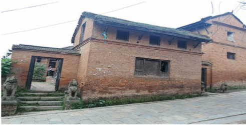
(चित्र नं. ३. मन्दिरको दुई तिरको धोका)