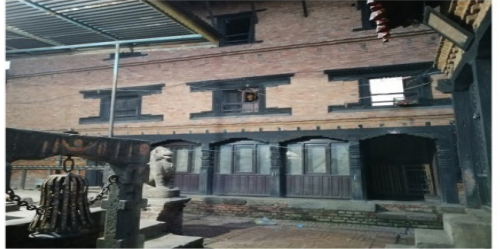
चित्र नं.४. चण्डी भगवती मन्दिर परिसरमा रहेका सत्तल