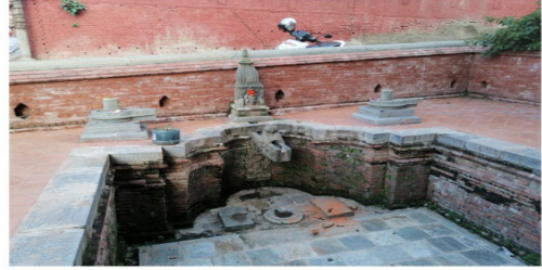
चित्र नं.२. चण्डी भगवती मन्दिर वाहिरको ढुङ्गेधारा