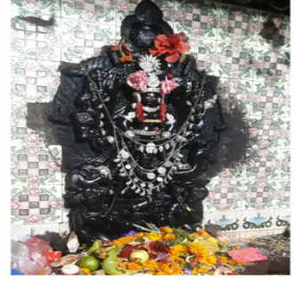
चण्डी भगवती( रंग लगाउदा दशैको नवमी, २०८०)त