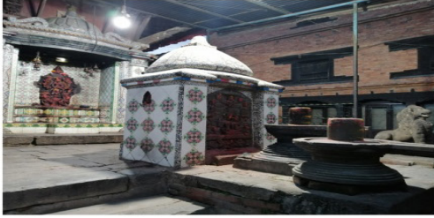
चित्र नं.१. चण्डी भगवती मन्दिर