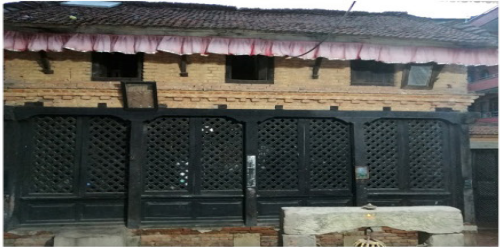
चित्र नं.६. परिसरमा रहेका पाटी