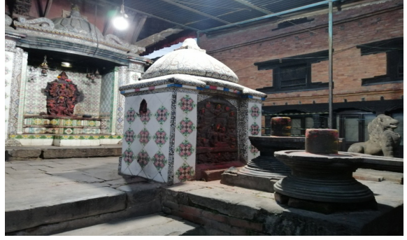
उमामहेश्वर र शिवलि