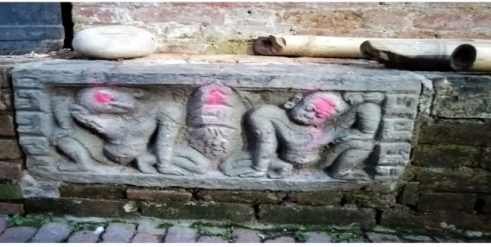
चित्र नं.५. परिसरमा रहेका सत्तलको पेटिमा रहेको जलद्रोणी