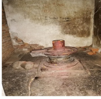
मन्दिरको मूल गर्भगृहमा रहेको शिवलिङ्ग)