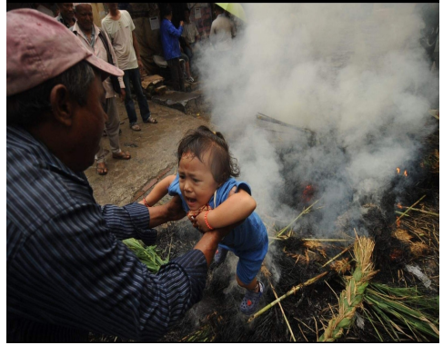
गथामगलाई अग्निदाह पश्चात निस्किएको धुवाँमा बच्चालाई 'कुँ पाङ्केउ' विधि गर्दै एक बुबा ।

गथामग जलाई खरानी भईसके पछि धुवाँमा नाघ्न लगाउने जस्ता क्रियाकलाप पनि गरिन्छ । स्थानीय जनधारणा अनुसार गथामग बालेको धुवाँमा बालबच्चालाई नाघ्न लगाएमा वा धुवाँमा छुवाएमा बालचरी रोगले बालबच्चालाई छुन पाउँदैन र बच्चाहरू स्वस्थ रहन्छ भन्ने मान्यता रहेको छ । यस कार्यको लागि बच्चालाई परिवारका कुनै पनि सदस्यले बोकेर नाघ्न लगाउने गर्दछ । यस कार्यलाई नेवारीमा 'कुँ पाङ्केउ' भनिन्छ । साथै यस चतुर्दशीकै दिन देखि नै लामखुट्टे हराउँछ भन्ने मान्यता पनि रहेको छ ।