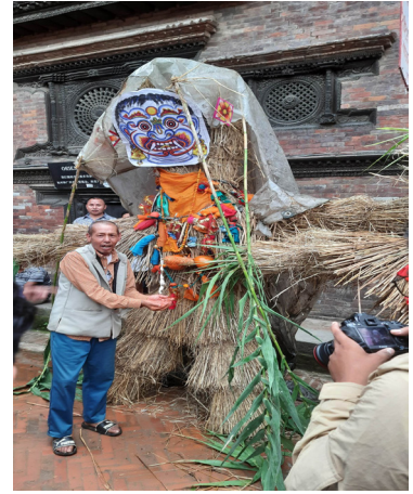
भक्तपुरको दत्तात्रय क्षेत्रमा निर्माण गरी राखेको गथामगको पूर्ण रूप।

काठमाडौं उपत्यकामा मनाउने महत्त्वपूर्ण जात्राहरू गाईजात्रा, दसैं, तिहार, संक्रान्ति, बिस्काः, इन्द्रजात्रा, घोडाजात्रा, शिवरात्री, पूर्णिमाहरू, श्री पञ्चमी, बुद्ध जयन्ती, कुमार षष्ठि लगायतका जात्रापर्वसँगै गथामग जात्रा पनि एक महत्त्वपूर्ण जात्रा हो। विशेष गरी नेवारी समुदायमा मनाइने यस गथामग जात्रा स्थानभेक अनुसार बोलाउने नाम तथा तौर-तरिका फरक रहेका छन्। नेवारी समाजमा गथामग, गाथामग, गथामंगल चःहे नामले प्रचलित रहेको यो दिनलाई गैरनेवार समुदायमा घण्टाकर्ण चतुर्दशीको नामले प्रचलित रहेको छ। उक्त दिन गैरनेवार समुदायमा लुटो फाल्ने अर्थात घरमा रहेको नकारात्मक शक्तिलाई घर बाहिर धपाउने र कुनै पनि रोगव्याधिले परिवारका सदस्यहरूलाई असर नगरियोस् भन्ने हेतुले कौसीमा धुनि बालेर मनाइन्छ भने नेवार समुदायमा गथामग नामको पात्रलाई राक्षस वा दैत्य मानेर समाज-कल्याणको निमित्त उक्त पात्रको ठूलो मानवकद बनाई शहरको मुख्य चौबाटोमा वा शहर बाहिर नदीको किनार वा बस्तीबाट टाढा लगेर जलाई अन्तिम संस्कार गरिन्छ।