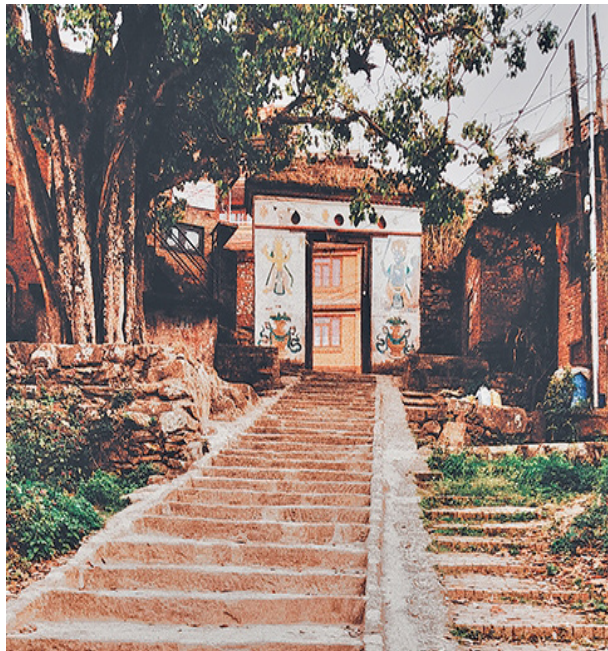
चित्र नम्बर २ : कीर्तिपुर सहरको किल्लाहरूमा रहेका मध्यकालिन ढोकाहरू मध्ये हालसम्म अस्तित्वमा रहेको देवढोका ।