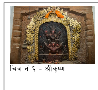
चित्र नं ६ - श्रीकृष्ण

एक मुख चाँदी टाँसिएको दुई आँखा भएका, चार हात भएका, मूल दुइ हात मुरली बजाइएको, बाँकी भएका दायाँ हातले चक्र र बायाँ हातले शङ्ख समाएका, शिरमा किरिटमुकुट, कानमा नागकुण्डल, घाँटीमा तक्षक नागको ग्रैवेयक र वैजयन्तीमाला, पाखुरामा केयूर, हातमा बाला र पाउमा कल्ली लगाएका, शरीरको माथिल्लो भाग निर्वस्त्र तर दुवै काँधमा उत्तरीय र तल्लो भागमा धोती लगाएका, दक्षिणावर्त कपाल भएको, कानमा नागकुण्डल, घाँटीमा तक्षक नागको ग्रैवेयक, हातमा कंकण लगाएका, दुवै हात फिँजाएर गरुडासनमा बसेका दुङ्गाको श्रीकृष्णको प्रतिमा छ (फोटो नं. ६) । यो