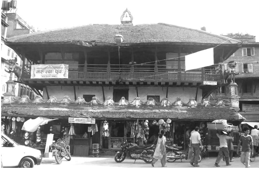
चित्र नं. १ सिंहसतल

सिंहसतलमा परिणत भयो । यो सतल कसले र कहिले स्थापना भएको हो भन्ने हालसम्म कुनै प्रामाणिक दस्तावेज पाइएको छैन । यस सतलको प्रारम्भिक वास्तु रूप कस्तो थियो र मौलिक रूपलाई नै निरन्तरता दिएको छ वा समयअनुसार परिवर्तन भएको छ पनि भन्न सक्ने कुनै आधार पाइएको छैन । यो सतल कसले, कहिले निर्माण गरिएको हो ? हाल यो सतल कसको अधीनमा रहेको छ? हाल यो सतल कुन प्रयोजनका लागि प्रयोग गरिएको छ ? यी विविध प्रश्नहरूको जवाफ यो पत्रले खोजिएको छ । यो पत्रले यस गौरवशाली सतल वास्तुको ऐतिहासिक दस्तावेज राख्न, पुरातात्विक र सांस्कृतिक महत्व दर्शाउन, यसको संरक्षण र सम्बर्द्धन गर्ने मूल उद्देश्य रहेको छ ।