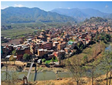
प्राचीन पनौती शहरको दृश्य,