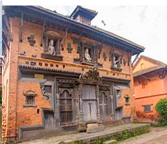
उन्नत भैरव मन्दिर र ढोका भयालमा कुँदैएका कलाकृति