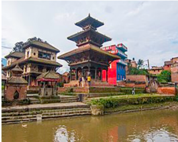
पनौतीको सांस्कृतिक धरोहर