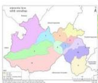
बागमती प्रदेशमा पनौतीको दृश्य निलो रङ, नेपालको नक्सामा पनौती रातो रङ ।