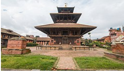
विशेश्वर महादेव मन्दिर