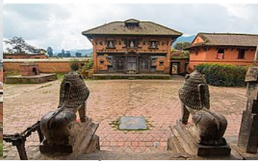
उन्नत भैरव मन्दिर