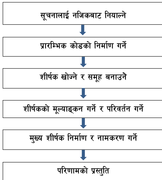
चित्र १. विश्लेषण प्रक्रियाका चरणहरू

सर्वप्रथम लिपिबद्ध गरिएका प्रत्येक अन्तर्वार्ताका हरेक अनुच्छेदबाट आवश्यकता अनुसार कोडिङ गरिएको छ । सम्पूर्ण कोडहरू जम्मा ३१४ वटा थिए । त्यसमा अध्ययनको उद्देश्यसँग सान्दर्भिक नभएका, उस्तै भएका र आशय दोहोरिएका कोडहरूलाई हटाउँदा १६७ वटा कोडहरू बनेका थिए । ती कोडहरूलाई पाँच समूहमा विभाजन गरी छुट्याइएका कोडहरूमा पनि केहीलाई एकआपसमा समावेश गरेर घटाई ३६ वटा बनाइएको थियो र अन्त्यमा पाँचवटा कोड समूहलाई पनि मिल्नेमिल्ने एक ठाउँमा गाभेर तीन समूह बनाइएको छ र ती कोडहरूलाई अनुसन्धानको उद्देश्य तथा अनुसन्धान प्रश्नअनुसार मिल्ने गरी अझ छुट्टाकाँट गरेर १४ वटा बनाइएको छ । तीन वटा कोड समूहलाई नै मुख्य शीर्षक (ग्लोबल थिम) का रूपमा राखिएको छ । यसरी कोडहरूबाट तयार पारिएका मुख्य शीर्षक (ग्लोबल थिम) र उपशीर्षक (थिम) हरूलाई चित्र २. मा प्रस्तुत गरिएको छ ।