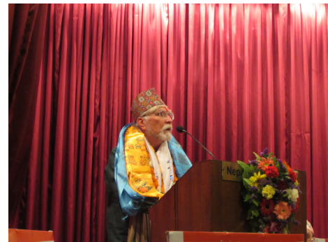
नेपाल सम्मान, २०७२ समर्पण कार्यक्रममा बोल्दै, काठमाडौं ।