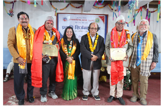
कलासाहित्य-यात्रा, जुम्ला, २०७६ (सिर्जना-उत्सवमा पुरस्कृत व्यक्तित्वसँग)