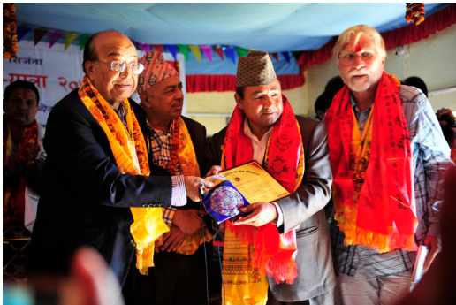
कलासाहित्य-यात्रा, जाजरकोट, २०७३ (सिर्जना-उत्सवमा पुरस्कृत व्यक्तित्वसँग)