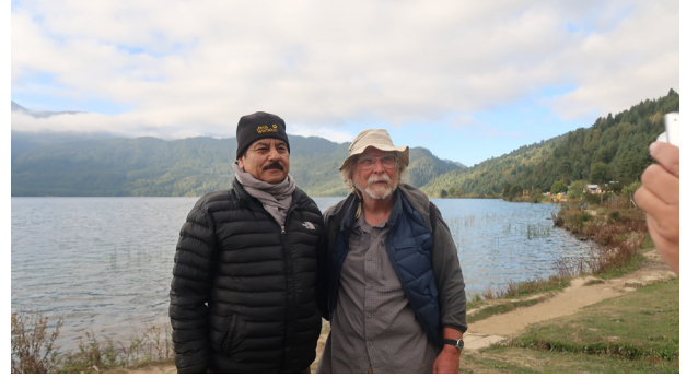
कलासाहित्य-यात्रा, मुगु, रारा, २०७६ (घुमघाम, लेखक र ग्रेगरी)