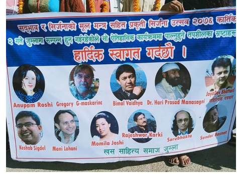
कलासाहित्य-यात्रा, जुम्ला, २०७६ (एयपोर्टबाट फूलमाला, पन्चैबाजा र नगरमा विशेष ब्यानसहित स्वागत)