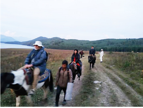
कलासाहित्य-यात्रा, मुगु, २०७६ (घुमघाम)