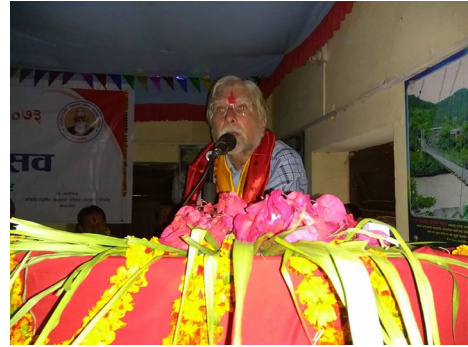
कलासाहित्य-यात्रा, जाजरकोट, २०७३ (सिर्जना-उत्सवमा बोल्दै)