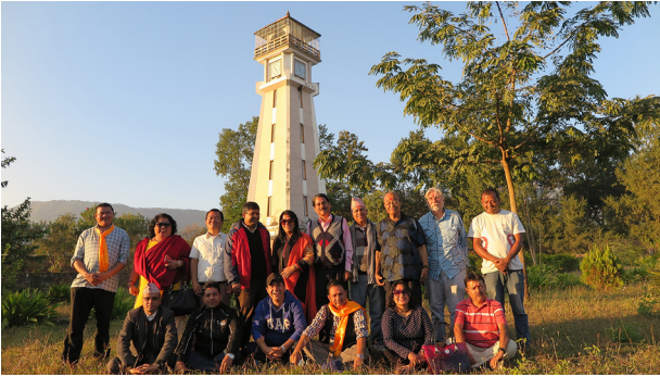
कलासाहित्य-यात्रा, जाजरकोट, २०७३ (घुमघाम, सुर्खेत)