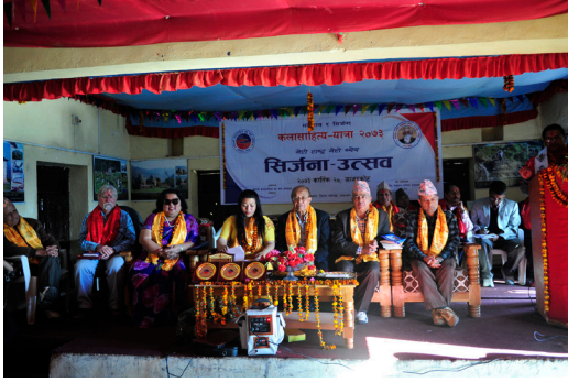
कलासाहित्य-यात्रा, जाजरकोट, २०७३ (सिर्जना-उत्सवमा मन्चासीन व्यक्तित्वहरू)