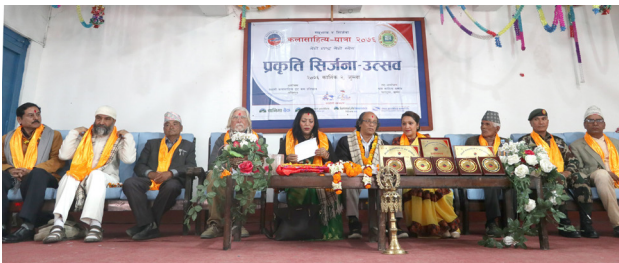
कलासाहित्य-यात्रा, जुम्ला, २०७६ (सिर्जना-उत्सव)