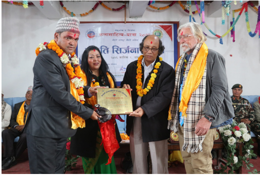
कलासाहित्य-यात्रा, जुम्ला, २०७६ (सिर्जना-उत्सवमा पुरस्कार प्रदान गर्दै)