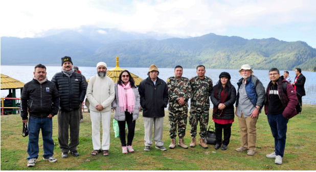
कलासाहित्य-यात्रा, मुगु, रारा, २०७६ (घुमघाम, सामूहिक तस्विर)