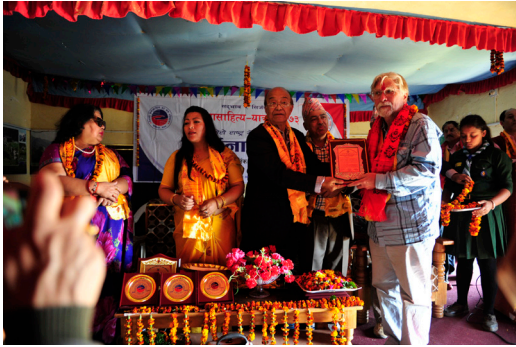
कलासाहित्य-यात्रा, जाजरकोट, २०७३ (सिर्जना-उत्सवमा)