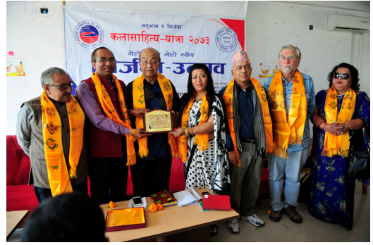
कलासाहित्य-यात्रा, कोहलपुर, २०७३ (सिर्जना-उत्सवमा)