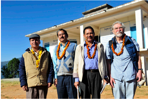
कलासाहित्य-यात्रा, जाजरकोट, २०७३ (सिर्जना-उत्सवमा घुमघाम, त्रिभुवन माध्यमिक विद्यालय अगाडि पूर्व शिक्षकहरू)