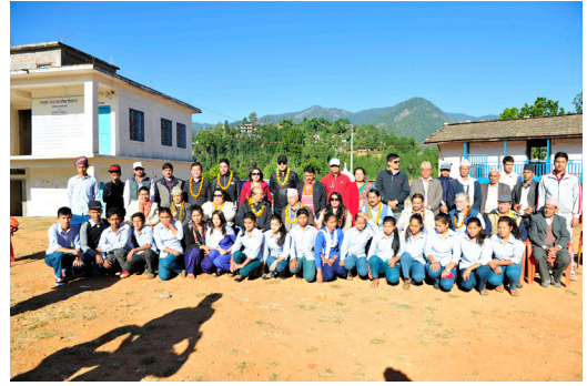
कलासाहित्य-यात्रा, जाजरकोट, २०७३ (सिर्जना-उत्सवमा घुमघाम, त्रिभुवन माध्यमिक विद्यालय अगाडि सामूहिक तस्वीर)