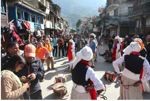
कलासाहित्य-यात्रा, जुम्ला, २०७६ (एयपोर्टबाट फूलमाला पन्चै बाजाले स्वागतपछि नाचगानसहित नगर परिक्रमा)