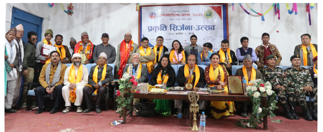
कलासाहित्य-यात्रा, जुम्ला, २०७६ (सिर्जना-उत्सव, सामूहिक तस्विर)