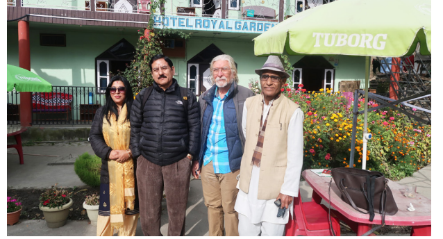
कलासाहित्य-यात्रा, जुम्ला, २०७६ (होटेलअघि)