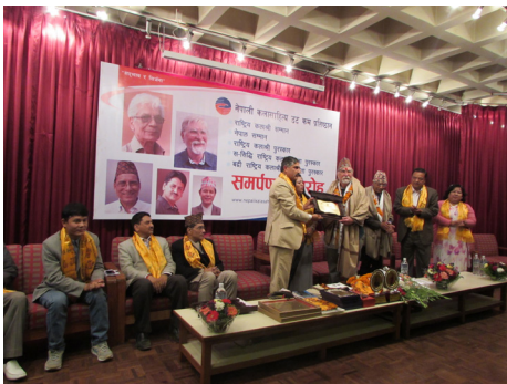
नेपाल सम्मान, २०७२ गृहण गर्दै, काठमाडौं ।