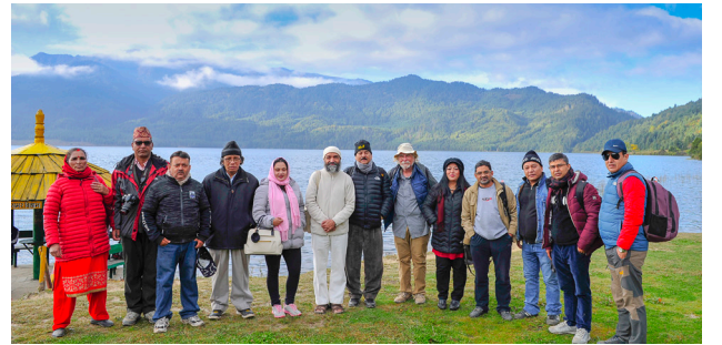
कलासाहित्य-यात्रा, मुगु, रारा, २०७६ (घुमघाम, सामूहिक तस्विर)