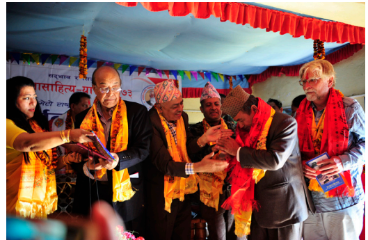
कलासाहित्य-यात्रा, जाजरकोट, २०७३ (सिर्जना-उत्सवमा पुरस्कृत व्यक्तित्वको पुस्तक विमोचन सन्दर्भ)