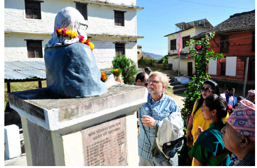
कलासाहित्य-यात्रा, जाजरकोट, २०७३ (सिर्जना-उत्सवमा लेखनाथ-पतिमामा माल्यार्पण गर्दै)