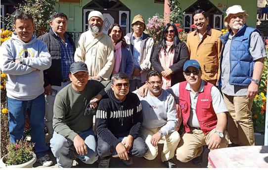
कलासाहित्य-यात्रा, जुम्ला, २०७६ (होटेल, सामूहिक तस्विर)