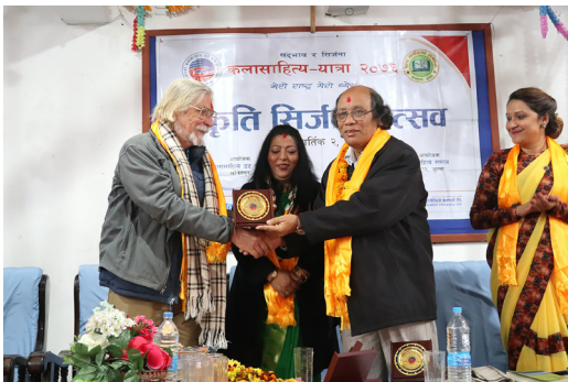
कलासाहित्य-यात्रा, जुम्ला, २०७६ (सिर्जना-उत्सवमा उपहार ग्रहण गर्दै)