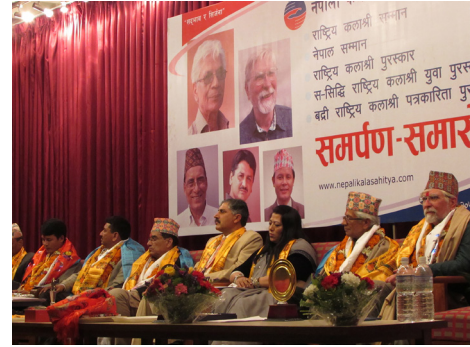
नेपाल सम्मान, २०७२ समर्पण कार्यक्रम, काठमाडौं