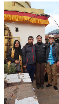
कलासाहित्य-यात्रा, जुम्ला, २०७६ (घुमघाम)